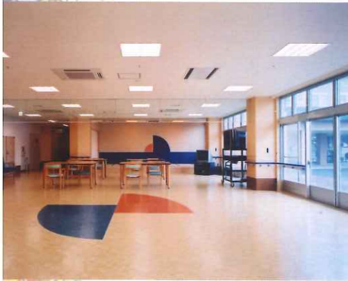
1F 食堂・デイルーム